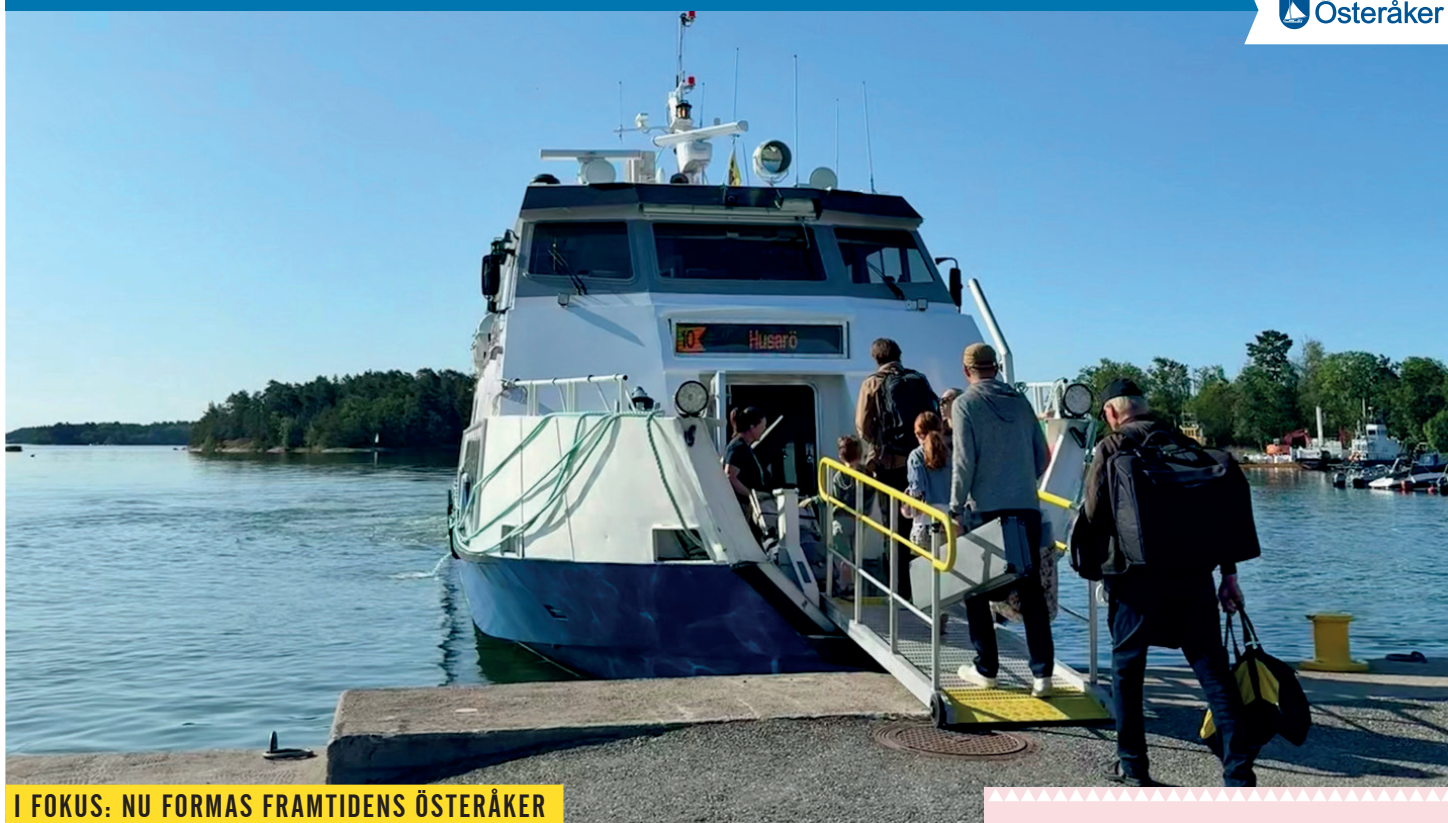
I FOKUS: NU FORMAS FRAMTIDENS ÖSTERÅKER