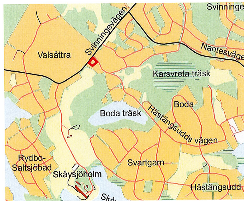
Orienteringsbild med planområdet markerat med röd linje