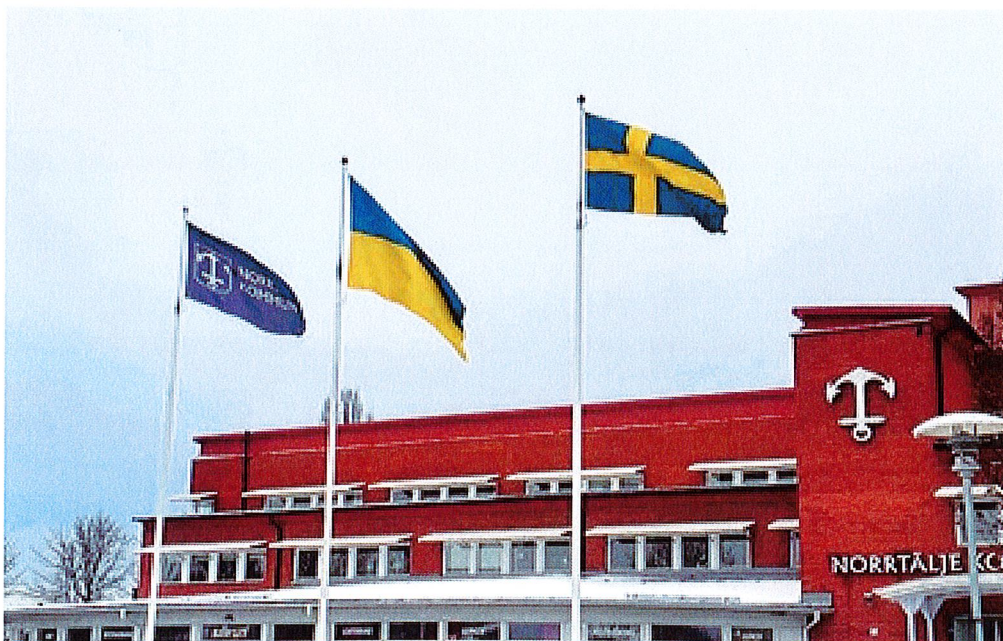
Ukrainas flagga utan för kommunhuset i Norrtälje

Kommer Österåkers kommun köpa in Ukrainiska flaggor till våra offentliga byggnader med flaggstänger och flaggar med dessa för att visa stöd med Ukrainas folk.