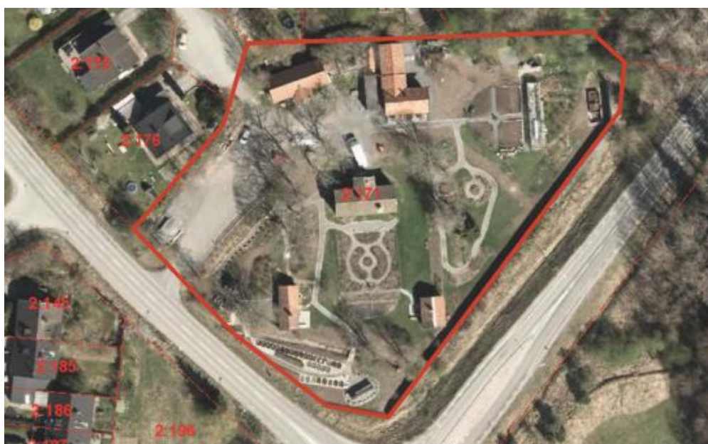
Figur 2. Preliminära planområdet.