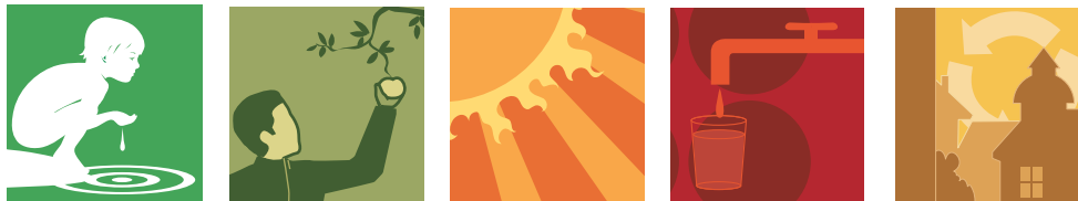
Figur 2 Avfallsplanens mål kopplar till generationsmålet och till de nationella miljö kvalitetsmålen Begränsad klimatpåverkan, Giffri miljö, Grundvatten av god kvalitet och God bebyggd miljö.

På nationell nivå kopplar avfallsplanens mål till generationsmålet 3 och till de nationella miljö kvalitetsmålen; i första hand Begränsad klimatpåverkan, Giffri miljö och God bebyggd miljö 4 .