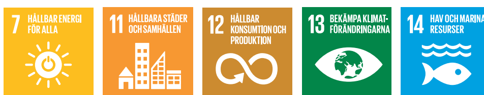
Figur 1 Avfallsplanen har kopplingar till flera av de globala målen.

På en övergripande nivå kopplar avfallsplanens mål till de globala målen Hållbar energi för alla, Hållbara städer och samhällen, Hållbar konsumtion och produktion, Hav och marina resurser, samt Bekämpa klimatförändringar.