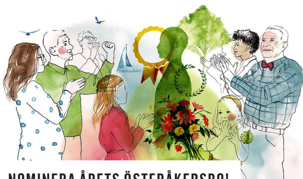
ILLUSTRATION: LINNEA BLIXT

Arbetet inleds under våren 2024. Konstnärernas skisser beräknas vara klara och presenteras under hösten.