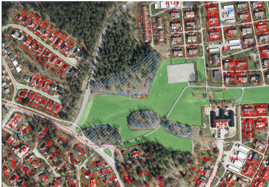
Gravfälten är blåmarkerade.