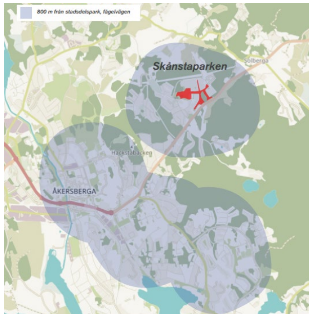
Karta från gestaltningsprogrammet