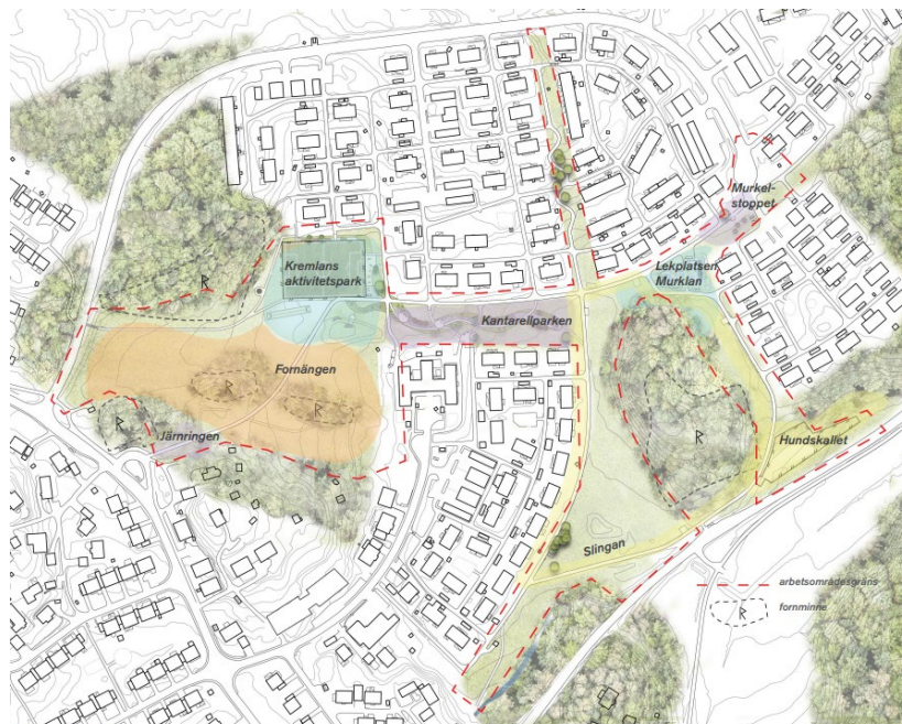
Karta från gestaltungsplanen med olika delområden i parken med finparken i mitten