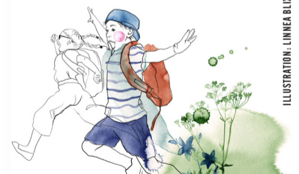
ILLUSTRATION: LINNEA BLIOT.

– Förskolans uppdrag är mycket större än vad det kan verka. Vi lägger grunden för barnens framtid och ser oss som en viktig del av barnets utveckling ända fram till studenten. När barnen slutar i förskolan hos oss får de med sig en sten som ska symbolisera trygghet och omtanke. Att vi alltid finns här för barnen när helst de skulle behöva oss. Vi bryr oss och vill att det ska gå bra för dem i livet. Vi har haft barn som återvänt till oss många år senare och visat upp att de fortfarande har sin sten i ryggsäcken och vi har ibland hjälpt till med frågor de har. De har varit så tacksamma, berättar Lena.