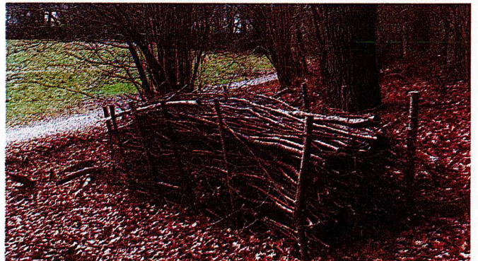
4. Benjeshäck i Grimsta