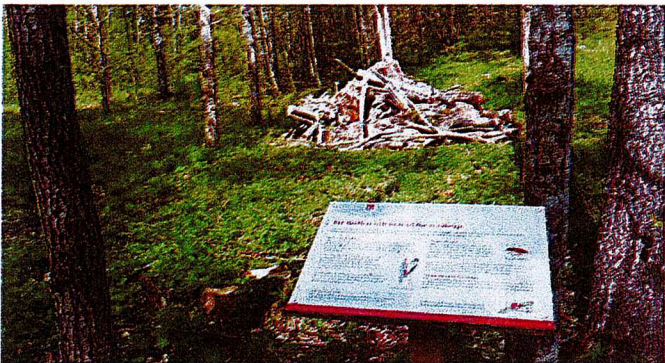
3. Faunadepå i Finspång (källa finspang.se)