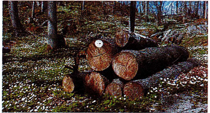
2. Faunadepå i Farsta