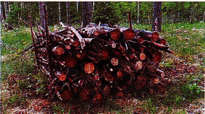
1. Faunadepå i Mariestad