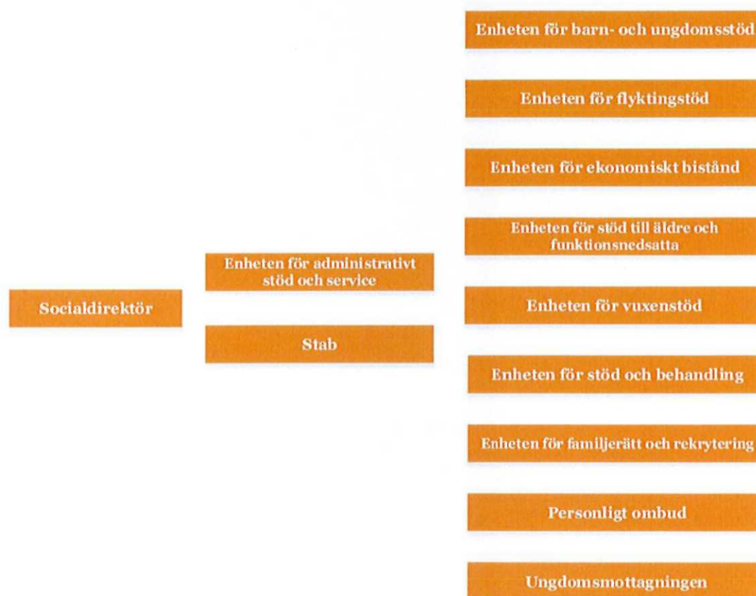
Figur 1, Organisationsskiss ny organisation fr.o.m. 1 januari 2017

För beroende- och missbruksvården innebär den nya organisationen att handläggningen och öppenvården separeras till olika enheter, vilka tidigare tillhörde samma enhet. I den nya organisationen återfinns handläggningen av beroende och missbruk samt LSS och socialpsykiatri inom Enheten för vuxenstöd medan Enheten för stöd och behandling består av missbruksvård, öppenvård och familjemottagning. Målsättningen med att samla utredningar och beslut om insatser är att få till stånd en närmare samverkan kring klienter/brukare som berörs av olika slags insatser.