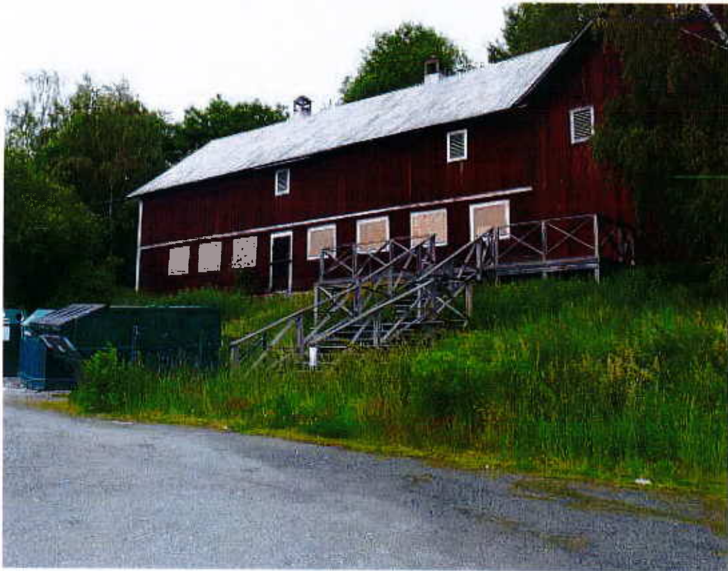
BEBYGGELSE PÅ FASTIGHETEN

UPPRÄTTAD DEN 20 NOVEMBER 2013 PÅ SAMHÄLLSBYGGNADSFÖRVALTNINGEN REVIDERAD DEN 9 APRIL 2014