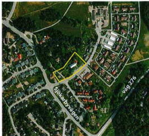
Fastighetens läge (gul markering) i närområdet.

Behovsbedömningen påvisar att miljö kvalitetsnormerna inte överskrids och att detaljplanen inte innebär någon betydande miljöpåverkan.