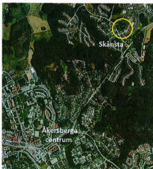
Översiktsskarta med Skånsta 3:17 inom den gula cirkeln.

Fastigheten Skånsta 3:17 ägs idag av Lundhs livs AB som också äger fastigheten på andra sidan Kantarellvägen där det finns en livsmedelsbutik.