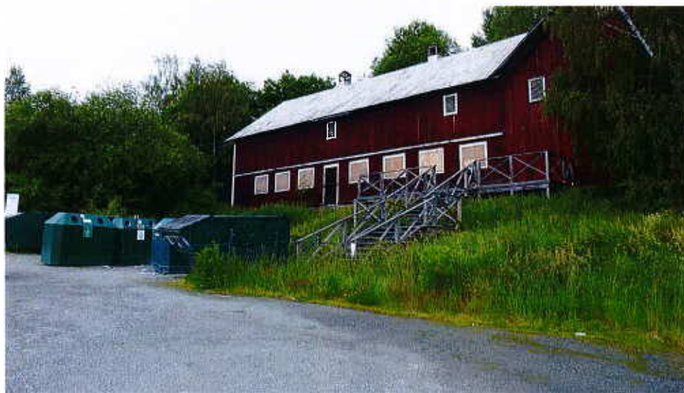
Fastigheten Skånsta 3:17 är idag bebyggd med en ladugård.

Fastigheten är tidigare bebyggd med en gammal ladugård med komplementbyggnader och uppställningsyta för en återvinningsstation och parkeringsplatser för livsmedelsbutik.