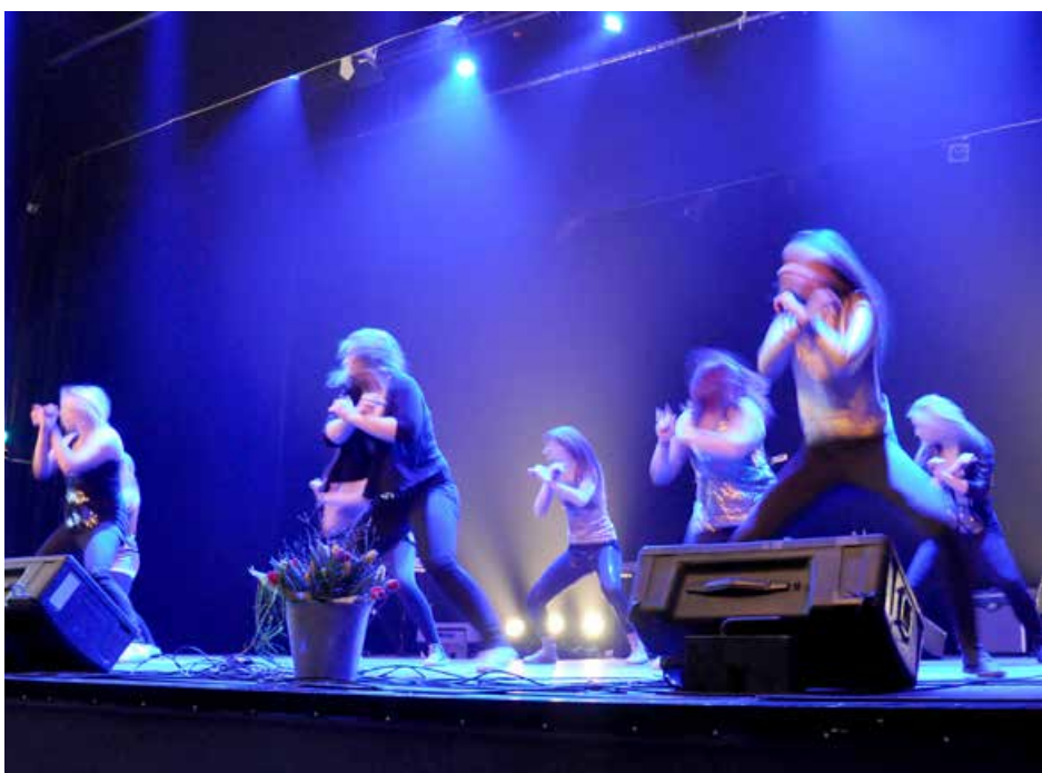
Nya Berga Teater invigdes i mars.