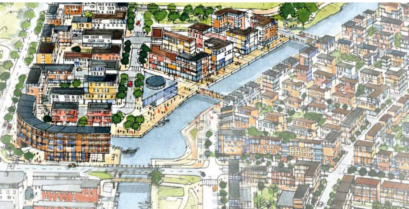
Detaljplanen för Östra Kanalstaden med 300 bostäder vann laga kraft. Illustration: Sweco.