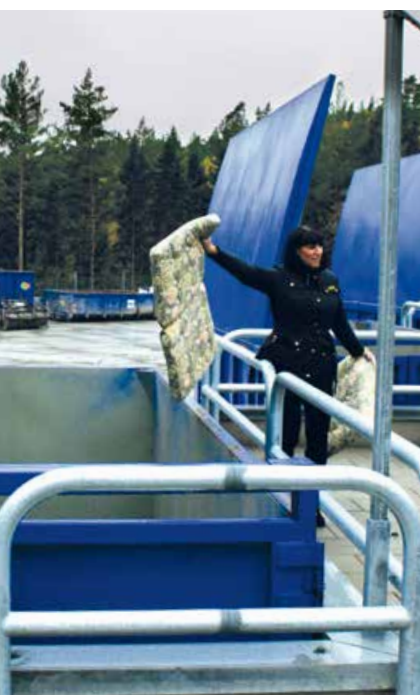
Ny återvinningscentral i Brännbacken.

Österåker växte med 477 personer under 2012. I slutet av maj passerades 40 000-strecket och kommunen hade 40 269 invånare vid årsskiftet.