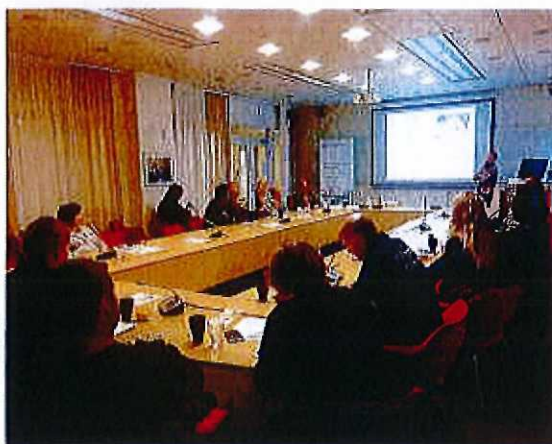
161013. Utbildning Neuropsykiatri

Totalt blev det fyra stycken gemensamma forum. 40 deltog i de två mindre frukostforum och 105 personer deltagit i de större gemensamma forum.