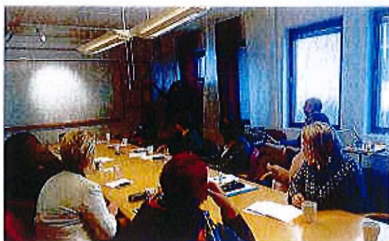
160212: Etableringsanalys ASF Täby

Den 11 november beslutat förbundets styrelse att stödja utvecklingen av ASF. En etableringsanalys genomfördes februari 2016 och ett uppföljningsmöte i juni. Resultatet blev projekt "Utveckla ASF i Täby" och utvecklingen av företaget re-invention startade. Totalt deltog 20 personer deltagit i insatsen. Syftet är att använda uppstartade arbetsintegrerade företag till arbetsträningsplatser i MiA-projektet.