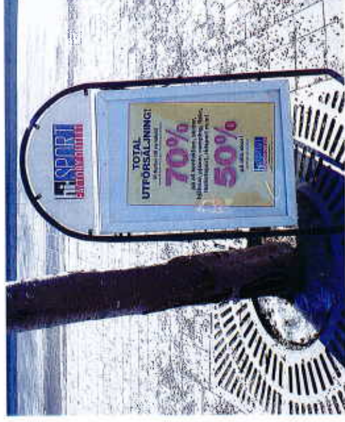
Exempel på vippskylt

Så kallad trottoarpratare är upplacerad på trottoarer eller torg, med syfte att framföra butiks- eller restaurangreklam. Den allmänna tillgängligheten kan störas då denna typ av skylt ofta orsakar problem för synskadade och andra funktionshindrade samt för renhållningsfordon. Vippskyltar får endast placeras i direkt anslutning till verksamheten, ska plockas bort över natten och kräver markägarens tillstånd.