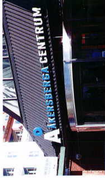
Exempel på friliggande bokstäver

Liknar planskylten men är en låda, med inbyggd armatur. Den är svår att anpassa till byggnadernas arkitektur och är lämplig i storskaliga miljöer. Stora lysande ytor bör undvikas och det är texten som ska vara lysande och inte bakgrunden. Karaktären av låda förstärks av ljus bakgrund och skyltlådor för lysrör godkänns i regel bara i handels- och industriområden.