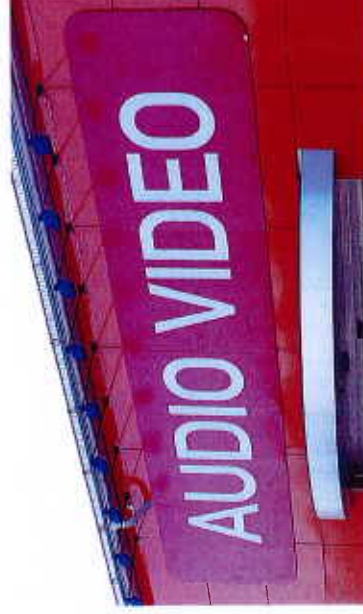
Exempel på skivskylt

Vanlig som butik- och verksamhetsreklam. Dioder har god ljusstyrka trots små dimensioner och gör dem speciellt lämpliga vid framställning av komplicerade varumärkesskyltar.