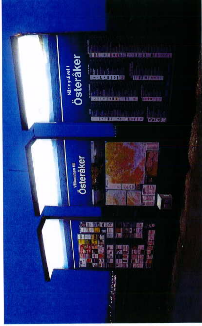
Foto informationsskylt Österåkers kommun

Att skyltar placeras i exponerade lägen kan vara en förutsättning för detta och genom tillämpning av skyltpolicyns riktlinjer ska företag och andra