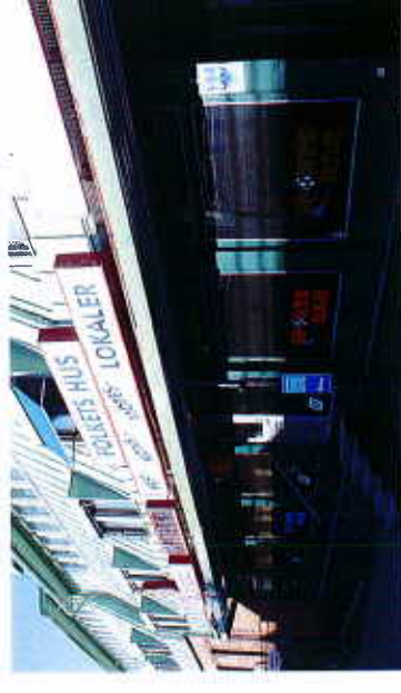
Exempel på skyltlåda