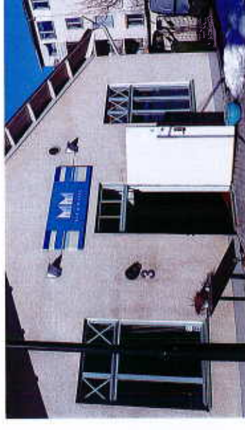
Exempel på planskylt