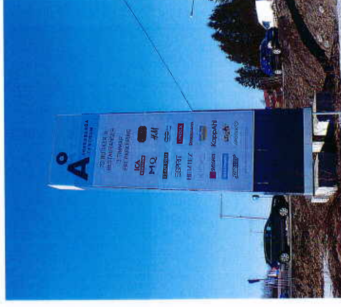
Foto samordnad skyltning vid infart till verksamhetsområde

Verksamhetsområden får en kraftigare skyltning än andra miljöer eftersom områdena präglas av en storskalig miljö. Skyltningen ska dock vara prydlig och framför allt vägledande.