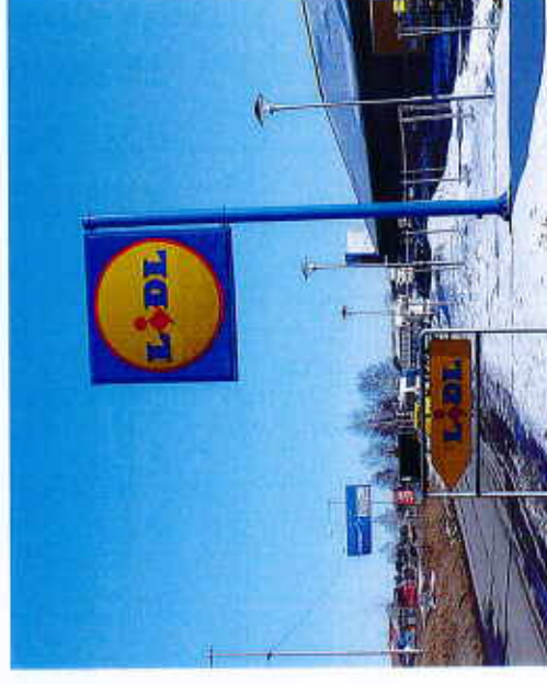
Exempel på stolpskylt

Står fritt och har sin egen bärande konstruktion. Konstruktionen bör utformas på ett sådant sätt att det förhöjer det estetiska värdet. Kan vara reklamplats för en verksamhet eller ett område och är oftast riktad mot trafikanter. Pyloner kan vara lämpliga i storskaliga miljöer som bensinmackar, industriområden eller affärscentrum. De ska i första hand placeras inom fastigheten som verksamheten tillhör.