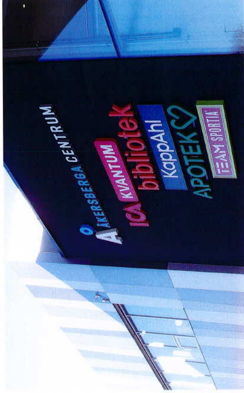
Foto skyltning på fasad Åkersberga Centrum

Kommunen har en restriktiv syn på reklamskyltar och reklamannonser.