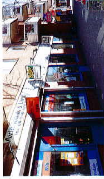
Exempel på utstående skylt