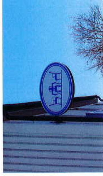
Exempel på utstående skylt