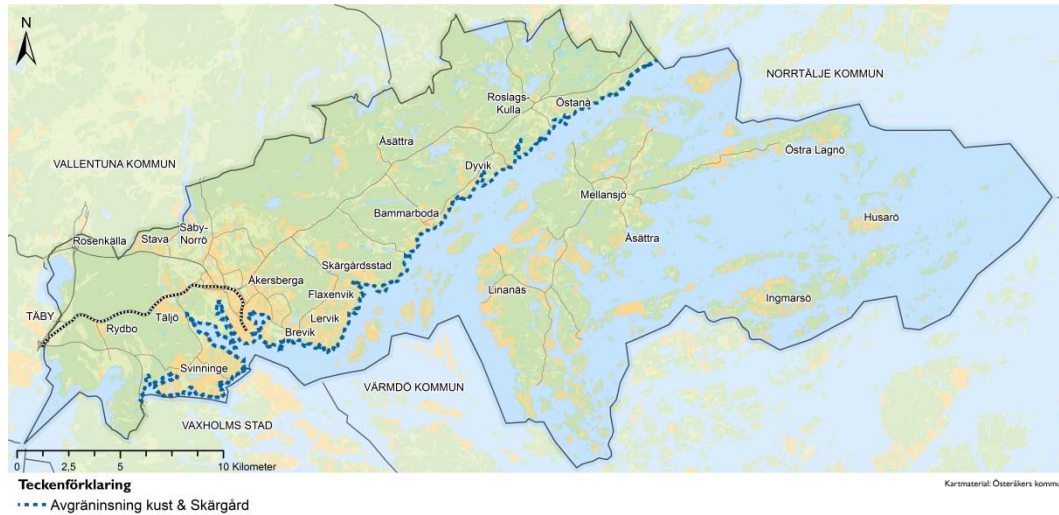
Karta 1. Geografisk avgränsning Tematiskt tillägg: Kust och Skärgård.

Det tematiska tillägget avser hela kommunens kuststreck och skärgård (se karta 1).