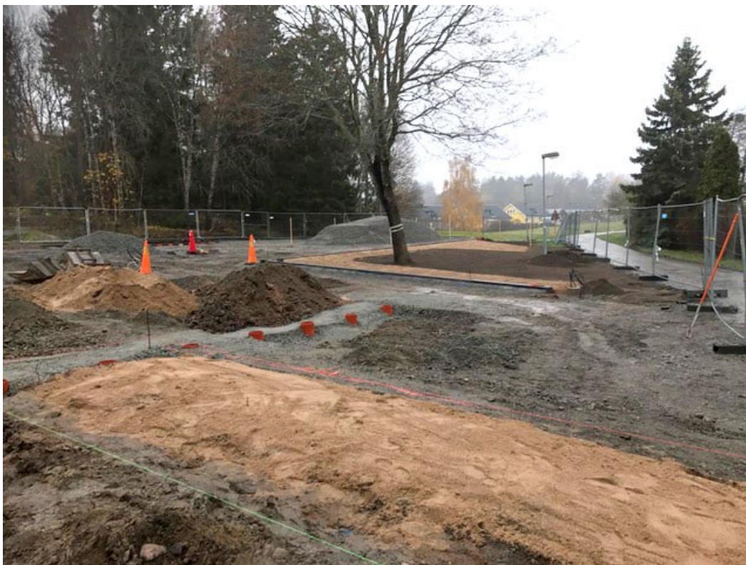
En av lökplanteringarna. Strösslad med sand.