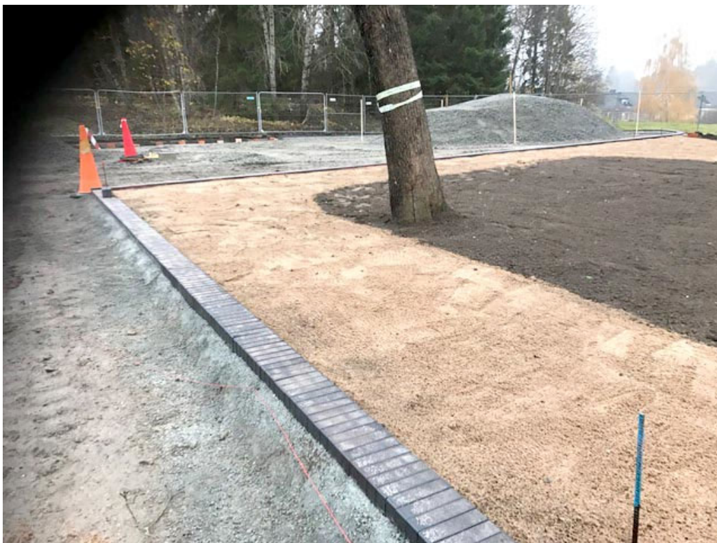
Marktegelfris i hörna mot befintlig lönn.