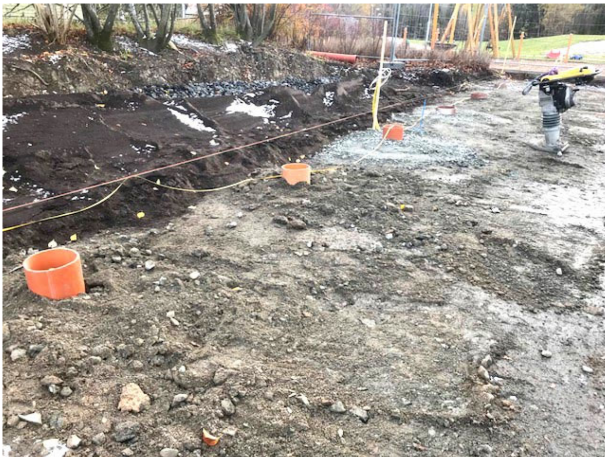
Ovan syns plint rör för pergolan som ska sitta som avgränsning mot släntplanteringen.