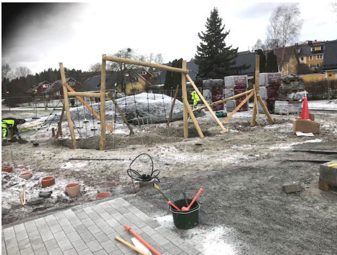
Parkouren efter gjutning. I nederkant syns också start med markstensläggning.