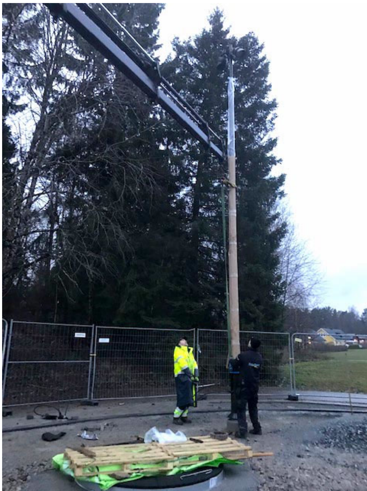
Högstolpar sätts på plats redan nu.