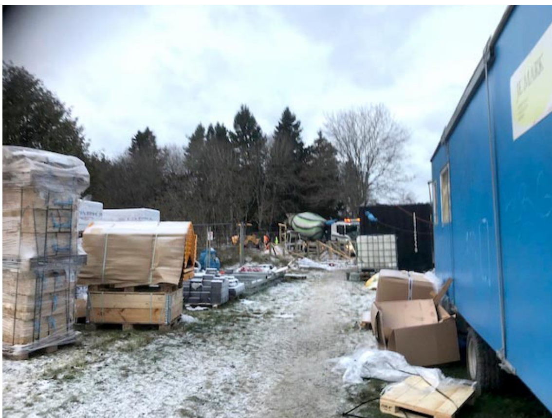
Mycket leveranser med utrustning börjar dyka upp. I bakgrunden syns betongbilen.