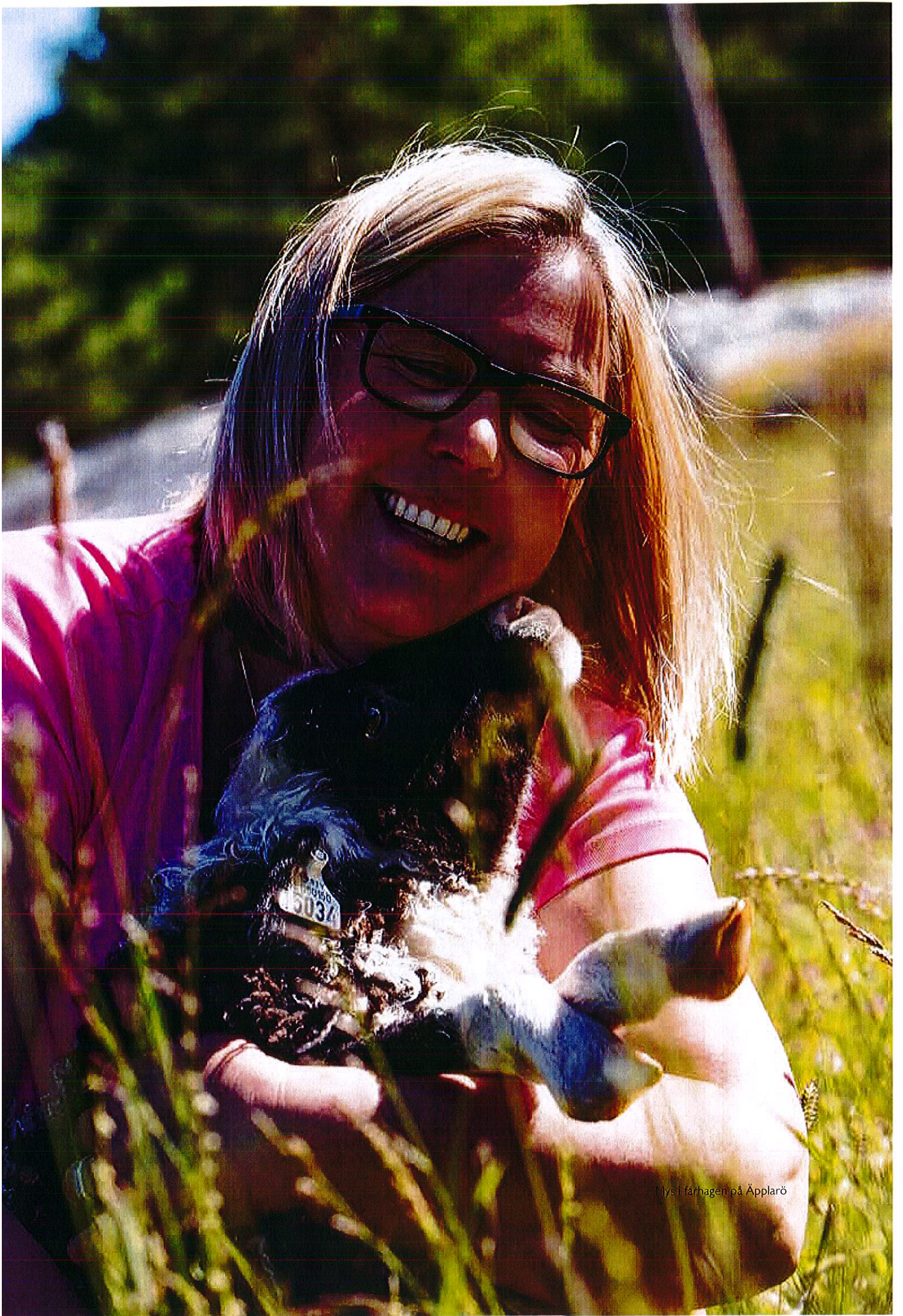
Mys i fårhagen på Äpplarö