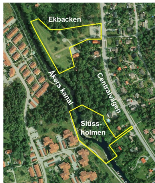
Bild 2. Preliminär avgränsning av planområdet i en nordlig och en sydlig del.