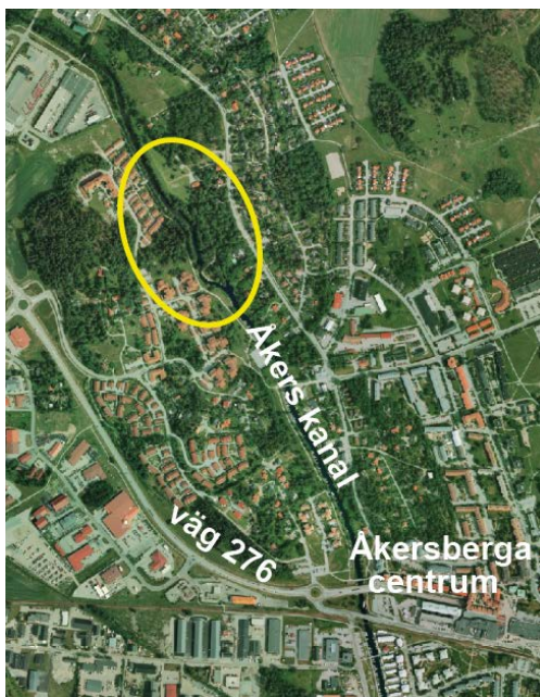
Bild 1. Planområdets läge i Åkersberga.

Det föreslagna planområdet är indelat i två delområden och är beläget inom och vid Åkers kanal i höjd med Slussholmen och Ekbackens friluftsområde, ca 1 km nordväst om Åkersberga centrum (se bild 1 och 2). Området innefattar del av fastigheterna Ekbacken 1:1, 4:1 och 9:1 samt Runö 6:1. Samtliga fastigheter ägs av Österåkers kommun.