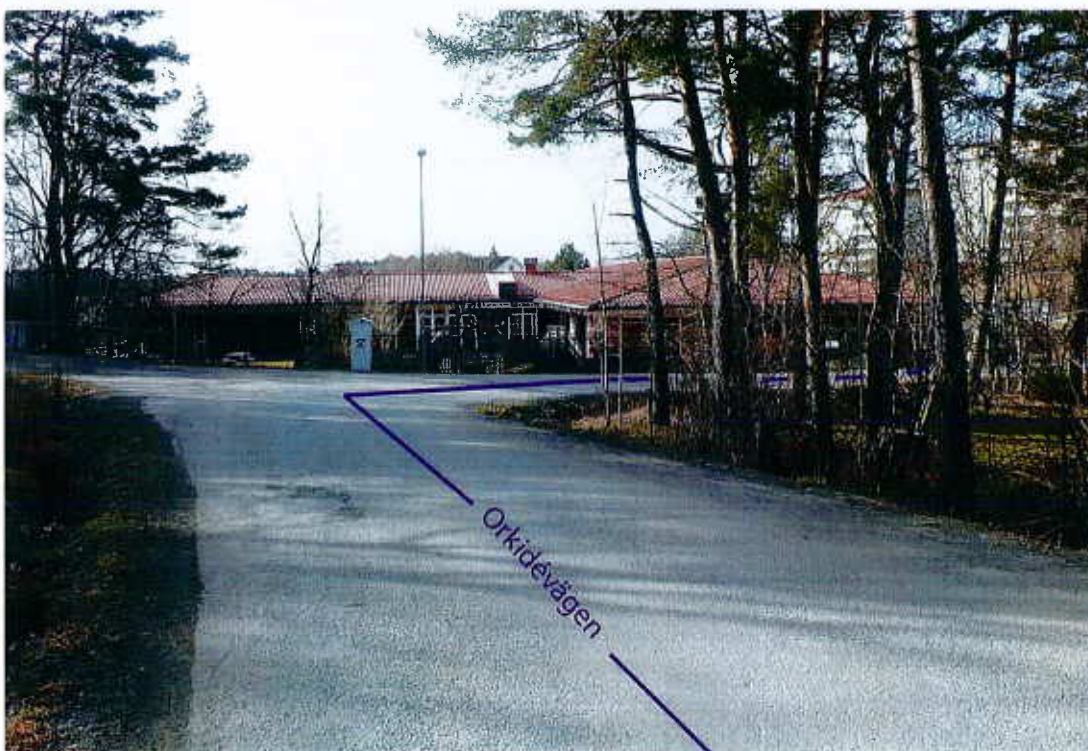
Orkidévägen, mars 2012