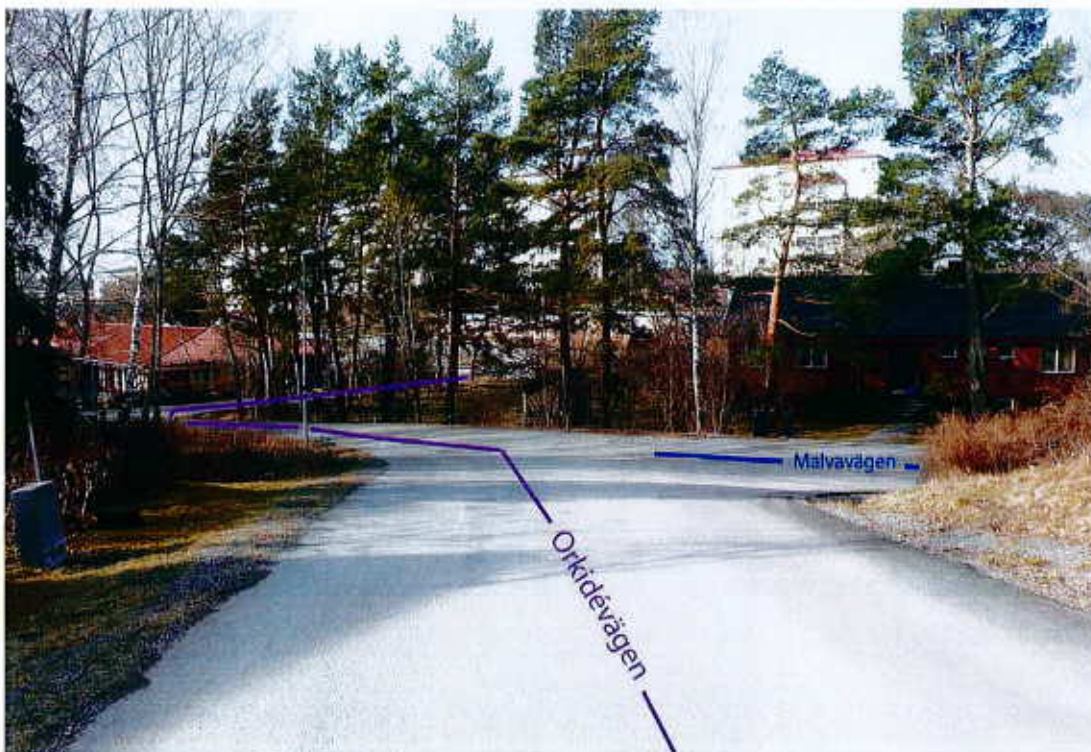
Korsningen Orkidévägen/Malvavägen, mars 2012