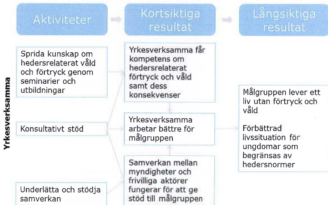
Figur 3 – Förenklad förändringsteori för Origos verksamhet för yrkesverksamma och frivilligsektorn

En förutsättning för att unga som utsätts för hedersrelaterat förtryck och våld ska få det stöd de behöver är att yrkesverksamma som möter ungdomarna har god kunskap inom området. Origo ska därför erbjuda kompetensutvecklande insatser för yrkesverksamma inom skola, socialtjänst, polis och landsting. Dessa insatser består av föreläsningar, utbildningar och informationsseminarier. Utöver dessa insatser ska yrkesverksamma kunna vända sig till Origo för konsultativt stöd i enskilda ärenden. Origo har även i uppdrag att stödja samverkan mellan aktörer. Ramböll bedömer att Origos konsultativa stöd bidrar väl till både ökad kompetens hos yrkesverksamma och att de yrkesverksamma som kontaktar Origo kan arbeta bättre för målgruppen. Genom föreläsningar bidrar Origo även till att höja kompetensen om hedersrelaterad problematik och till att öka kännedomen om hur Origo kan ge stöd till ungdomar och yrkesverksamma. Ramböll ser att de kompetenshöjande effekterna är som starkast på individnivå och mindre framträdande på organisationsnivå. Ramböll bedömer att Origo i viss utsträckning bidrar till samverkan mellan aktörer.