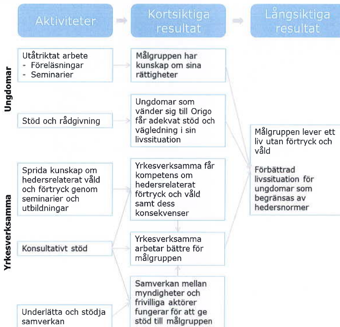
Figur 1 – Förenklad förändringsteori för Origo